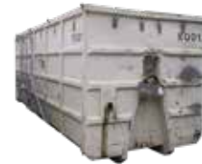
40 m 3 Abrollcontainer